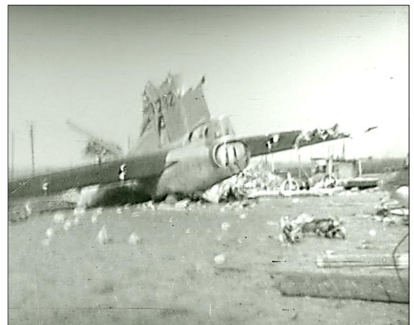
Bruch der B-17 Fortress # 42-102482 nahe dem Bahnhof in Fümmele (Oben)