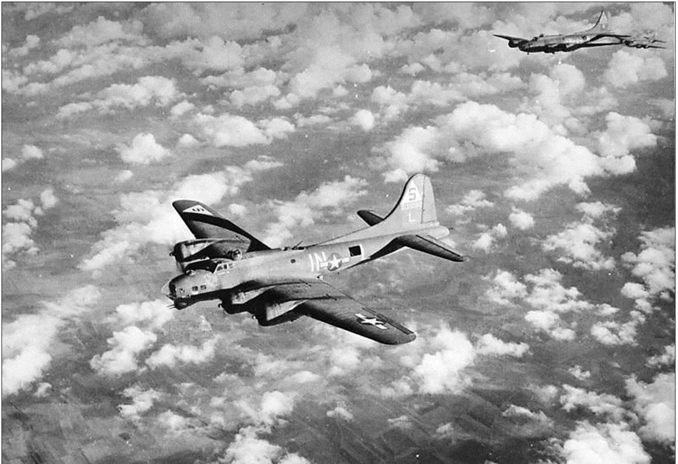
B-17 F-125-BO Fortress # 42-30855 „Ol` Massa“ wird durch Flakartillerie abgeschossen (Oben)

401st B.G. / 613th B.S. / B-17 F-125-BO Fortress / # 42-30855 / „Ol` Massa“ / Beschuss durch Flak - 2./schwere Flak-Abteilung 185 (o) + 7./schwere Flak-Abteilung 306 (o) + 1./schwere Flak-Abteilung 137 (o) / Absturz bei Balkum, nordwestlich Hesepe (Niedersachsen) - Deutschland / 2nd Lieutenant Dana M. Lenkeit / 7 gefallen / 3 Fallschirmabsprung - KG